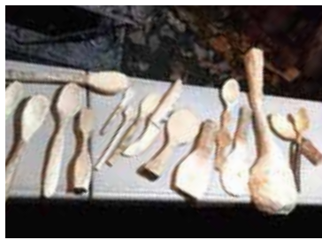
「カービングナイフで森のクラフトづくり」