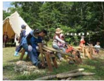
「ウッドランドガーデンの杭を作ろう!!」