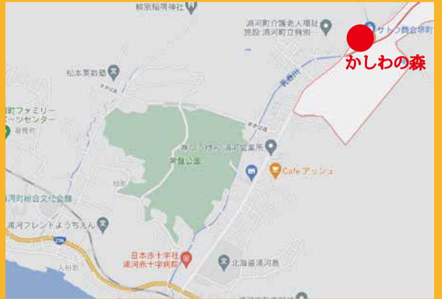
野塚国道 236 号 (札幌方面より) 赤十字病院で左折 1.2km 直進